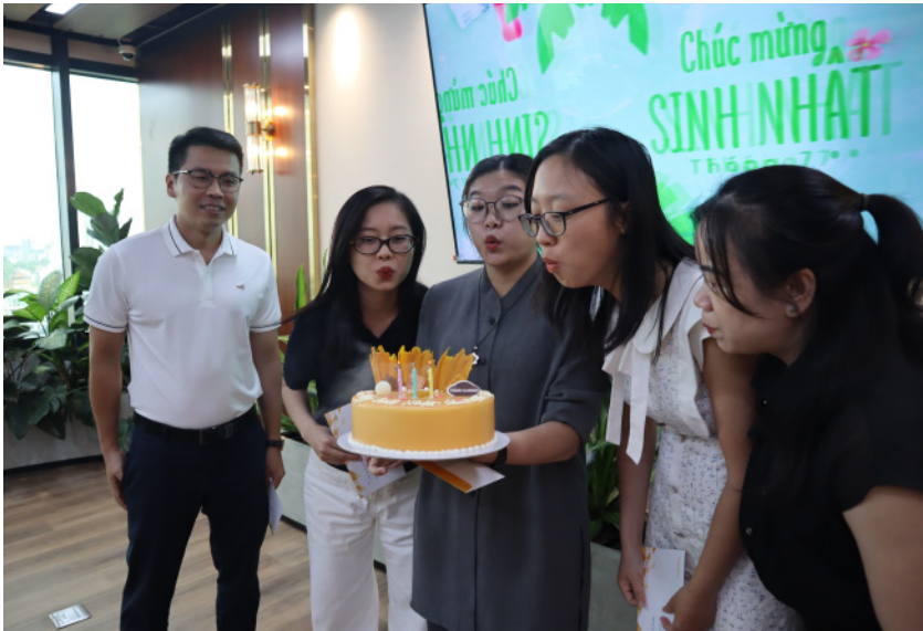
Những khoảnh khắc tuyệt vời khi các thành viên Thaiholdings được quây quần cùng nhau và gửi lời chúc tới các anh chị em thân yêu